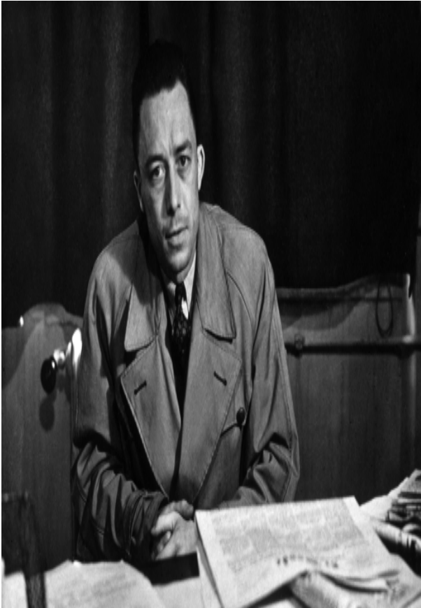
صورة للكاتب البير كامو

CAMUS,Albert